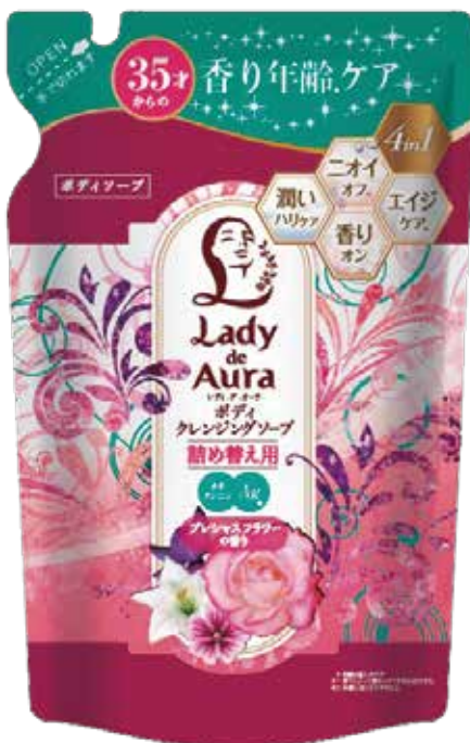
レディ・デ・オーラ ボディクレンジングソープ 詰め替え用 320mL 647円(税抜)