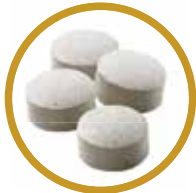
なかつたコトに! R40 120粒(約30食分) 1,680円(税抜)