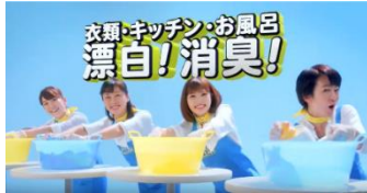
③衣類・キッチン・お風呂、色々漬けちゃおう!