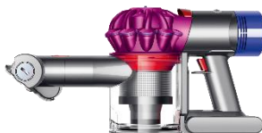
Dyson V7 Trigger