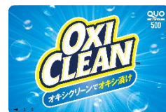
オリジナルQUOカード 500円分