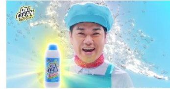
②「オキシ漬け」を家事えもんがレクチャー!