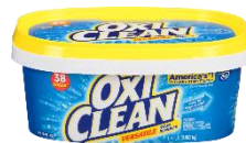
オキシクリーンEX 802g 1,110円（税抜） JAN : 4571169853852