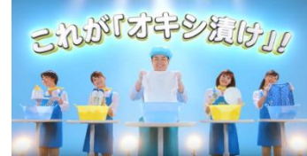
④ピカピカ、きれいに!これがオキシ漬け!