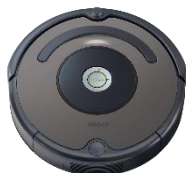
アイロボット ルンバ643