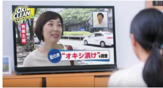
①近頃、巷でよく見る「オキシ漬け」って?