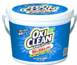
オキシクリーン1500g 1,280円（税抜） JAN : 4582107953718