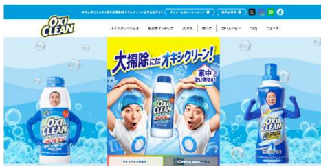
大掃除特設サイト