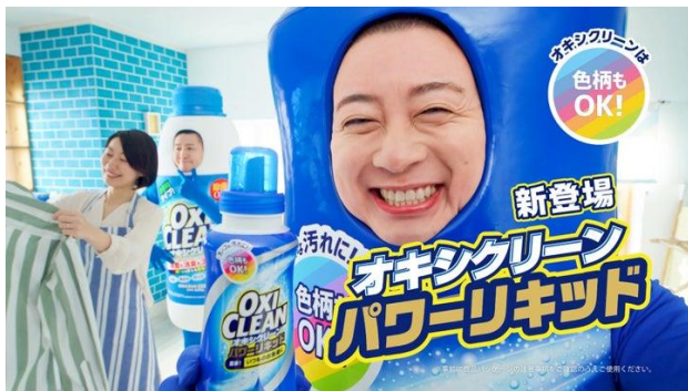
2024年4月1日（月）～放映 「パワーリキッド登場」篇

2024年12月13日（金）からは、チョコレートプラネットさんの大人気ネタの1つ、「TT兄弟」をオマージュした新作CMが放映開始いたします。オキシクリーン（OXICLEAN）の「O」がプリントされた白Tシャツと鮮やかなブルーのウィッグを身にまとった「OO兄弟」が、オキシクリーン1本でできる大掃除をコミカル&リズムカルに紹介していきます。