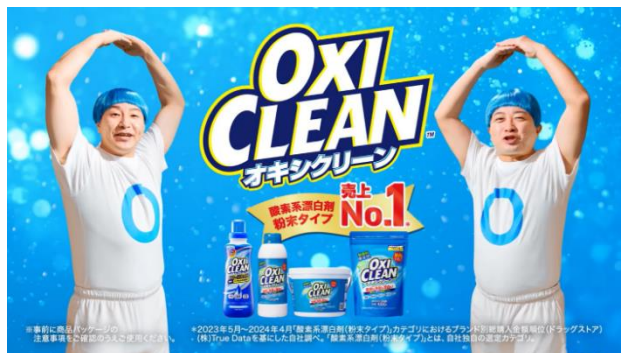
2024年12月13日（金）～放映 「大掃除にはオキシクリーン」篇